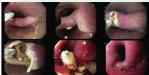
Figura 2. Visión endoscópica del diverticuloscopio colocado y el septum expuesto (A). El corte se realiza con needle knife con corriente de coagulación en forma secuencial hasta los 5 mm del fondo del DZ (B-D). Se colocan clips metálicos (E). Visión endoscópica 30 días posteriores a la miotomía (F).